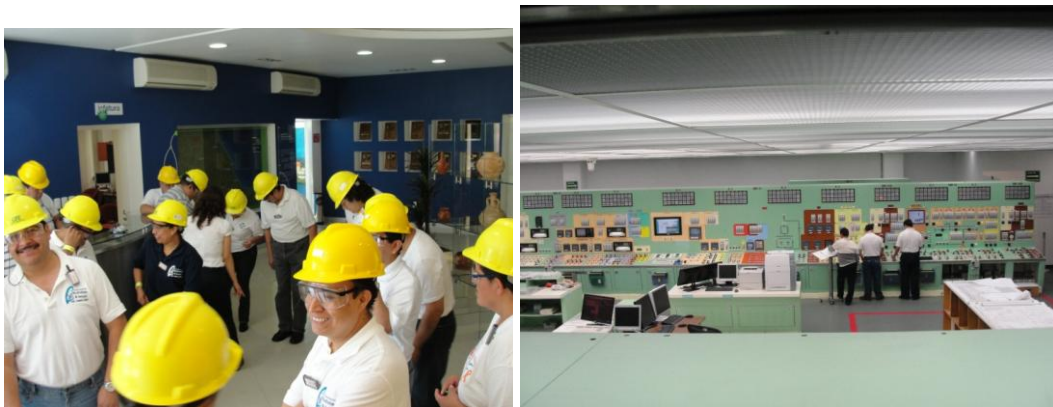
Fig. 2. Visita a las Instalaciones de la Central Nuclear Laguna Verde